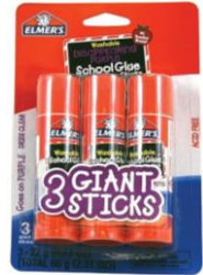
3 BARRAS DE PEGAMENTO GRANDES