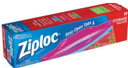
BOYS - GALLON SIZE ZIPLOC BAGS