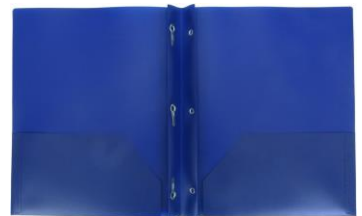
4 PLASTIC FOLDERS WITH PRONGS