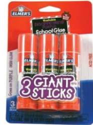
3 BARRAS DE PEGAMENTO GRANDES