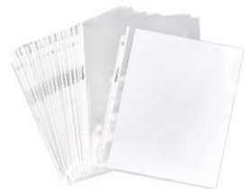
UN PAQUETE DE PROTECTORES DE HOJAS