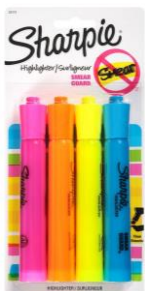
1 PACK OF HIGHLIGHTERS