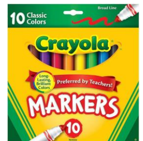
1 CAJA DE MARCADORES