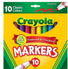
1 PACK OF MARKERS