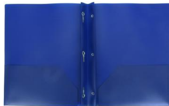
3 PLASTIC FOLDERS WITH PRONGS