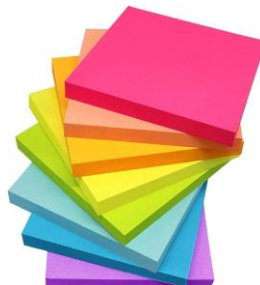
2 PACKS OF POST ITS