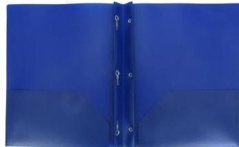
3 CARPETAS DE PLÁSTICO CON GANCHOS