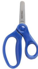
1 PAR DE TIJERAS PARA NIÑOS