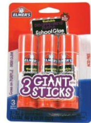
6 LARGE GLUESTICKS