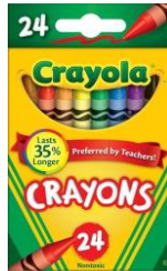
2 BOXES OF CRAYONS