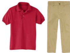
UN CAMBIO DE ROPA