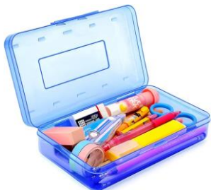
1 ESTUCHE PARA LÁPICES