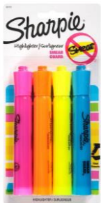
1 PACK OF HIGHLIGHTERS