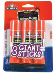
3 LARGE GLUESTICKS