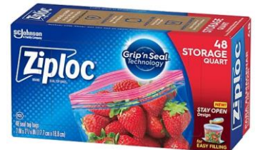
NIÑAS - BOLSAS ZIPLOC TAMAÑO CUARTO