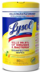
2-3 CONTAINERS OF DISINFECTING WIPES