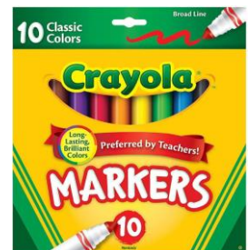
1 PACK OF MARKERS