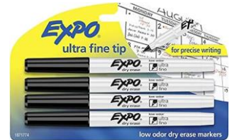
1 PAQUETE DE MARCADORES DE BORRADO EN SECO DE PUNTO FINO