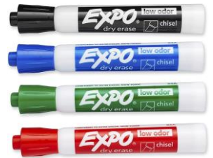
1 PAQUETE DE MARCADORES DE BORRADO EN SECO