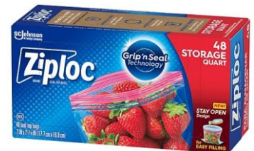
GIRLS - QUART SIZE ZIPLOC BAGS