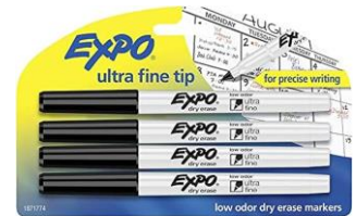
1 PACK OF FINE POINT DRY-ERASE MARKERS