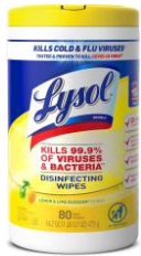
2-3 CONTENEDORES DE TOALLAS DESINFECTANTES