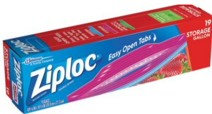
NIÑOS - BOLSAS ZIPLOC TAMAÑO GALÓN