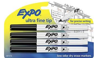
1 PAQUETE DE MARCADORES DE BORRADO EN SECO DE PUNTO FINO