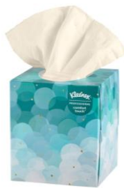
2-3 BOXES OF TISSUE