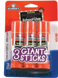
3 LARGE GUESTICKS