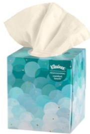
2-3 BOXES OF TISSUE